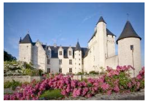
Château du Rivau