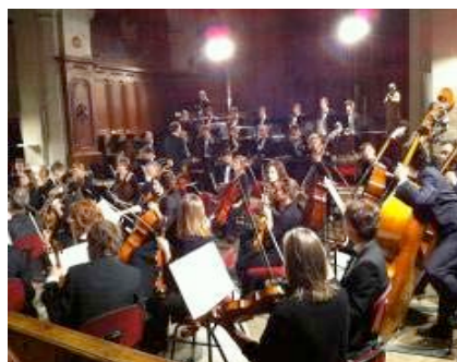
Orchestre Symphonique Région-Centre (août)