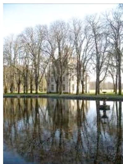
Dôme du Parc de Richelieu, vestige du château. ancien manège pour les chevaux

Plus d'informations : www.ville-richelieu.fr