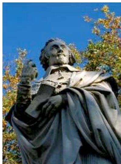
Statue de Richelieu, place du Cardinal