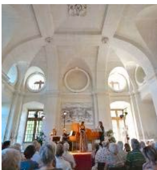
Concert dans le Dôme de